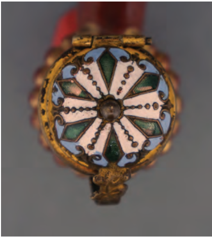
Afb. 4. Geëmailleerd deksel met geometrische patronen op een Tophane pijp gemaakt door Hasan. Deksel gemerkt 'JH'. (collectie auteur, AH-1006)