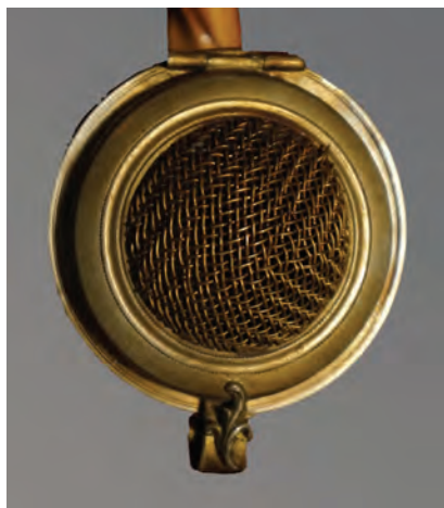
Afb. 10. Gaas decoratief deel op een meerschuur pijp uit Thüringen. Deksel gemerkt 'JK'. (collectie Higgins, 1108.21)