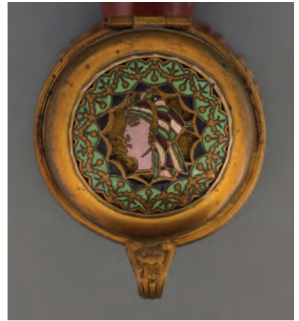
Afb. 6. Geëmailleerd deksel met portret van een Egyptenaar gemaakt door Hasan. (collectie auteur, AH-1005)