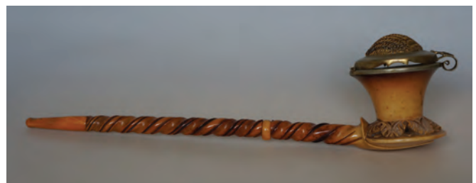
Afb. 14. Meerschuum pijp gemaakt in Thüringen, vermoedelijk Ruhla. Deksel gemerkt 'JK.'. (collectie Higgins, 1108.21)