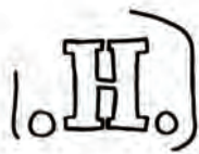
Afb. 18. Merk van de dekselmaker, '.H.'. Zie afb. 10.