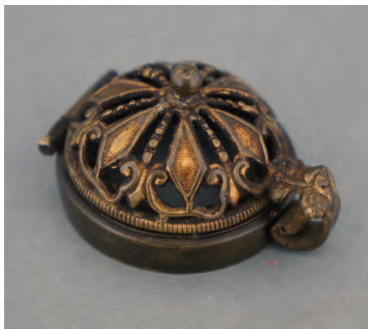
Afb. 11. Ajour gezaagde geperste deksel, vergelijkbaar met afb. 3. Deksel gemerkt onleesbaar (Afb. 18.) (collectie auteur, AH-1011)