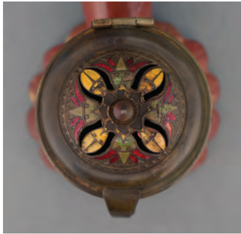
Afb. 5. Geëmailleerd deksel met scarabeeën en papyrus bloemen op een Tophane pijp gemaakt door Hasan. (collectie auteur, AH-1008)