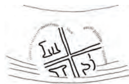
Afb. 20. Merk van de dekselmaker, vermoedelijk 'H-I-S'. Zie afb. 13.