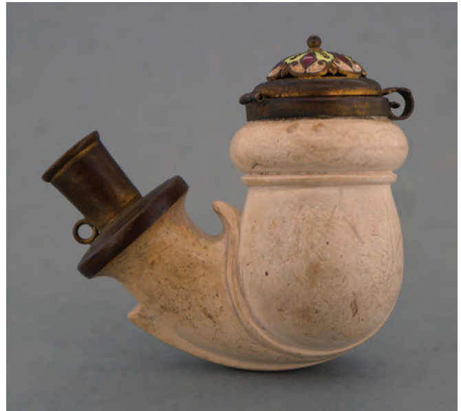
Afb. 12. Meerschuum pijp gemaakt in Thüringen, vermoedelijk Ruhla. Deksel gemerkt 'H.'. (collectie auteur, AH-1013)

Naast de pijpen uit Tophane en Thüringen is er een derde groep te benoemen. Het gaat hierbij om pijpen uit Schemnitz (Banská Štiavnica, Slowakije). Een pijp in de collectie van de auteur is gemaakt door Karol Zachar in Slowakije. (Afb. 15) Deze pijp is gemodelleerd naar het voorbeeld van de Turkse pijpen uit Tophane waarbij de decoratie grotendeels als reliëf op de kop ligt. Deze pijp is rood geschilderd met details in goudverf om het Tophane aardewerk zo goed mogelijk te simuleren. In de collectie van het Amsterdam Pipe Museum bevinden zich nog twee pijpen uit Schemnitz die afgemonteerd zijn met samengestelde deksels. Het gaat om een figurale pijp van Karol Zachar. 6 (Afb. 16) De ketel is gemodelleerd als een bebaarde man met tulband. Ook deze pijp heeft dus Oriëntaalse invloeden. De tweede pijp is een