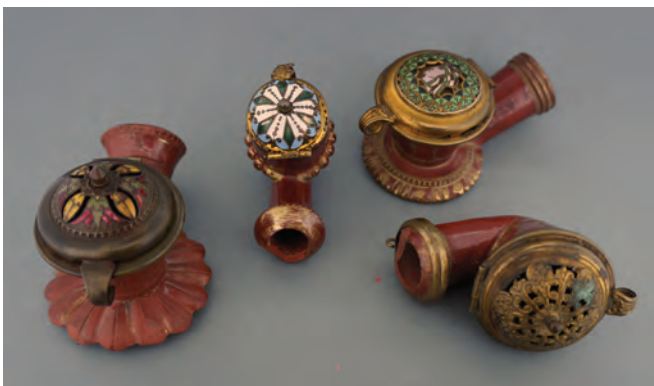
Afb. 1. Vier Tophane pijpen afgemonteerd met samengestelde deksels, eerste kwart twintigste eeuw. (collectie auteur)

Type 2: Deksel waarbij het decoratieve centrale deel niet geëmailleerd is.