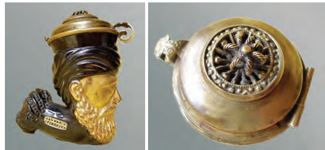
Afb. 16. Slowaakse kleipijp gemaakt door Karol Zachar. (collectie Amsterdam Pipe Museum, PK 19.470.)