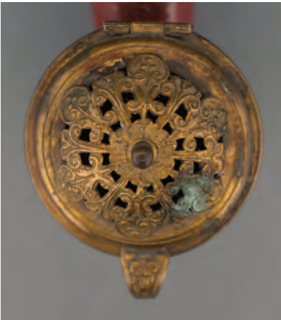
Afb. 7. Geperst decoratief deel op een Tophane pijp gemaakt door Hasan. Deksel gemerkt 'JH'. (collectie auteur, AH-1004)