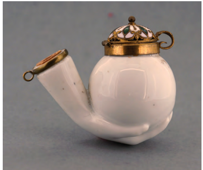
Afb. 13. Porseleinen pijp gemaakt in Ruhla. Deksel gemerkt 'CSs'; Christian Schütze & Sohne. (collectie auteur, AH-1012)