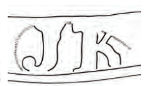
Afb. 21. Merk van de dekselmaker, 'JK'. Zie afb. 9, 12.