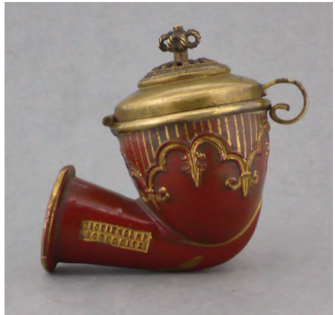
Afb. 15. Slowaakse kleipijp gemaakt door Karol Zachar. (collectie auteur, AH-1014)

Het feit dat de pijpen van slechts drie in Tophane gevestigde pijpenmakers door een enkele 'Pfeifenbeschläger' werden afgemonteerd, duidt op een zeer directe en vrij beperkte export en import tussen Turkije en Duitsland. Dat afmonteringen die geproduceerd zijn in en om Ruhla teruggevonden worden op pijpen uit Turkije en Slowakije, duidt eens te meer op de sterke marktpositie van Ruhla aan het begin van de negentiende eeuw.