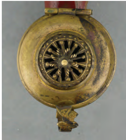
Afb. 8. Geperst decoratief deel op een Slowaakse pijp gemaakt door Karol Zachar. (collectie auteur, AH-1014)