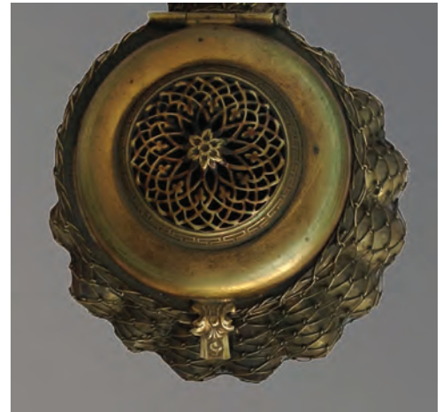
Afb. 9. Ajour gezaagd decoratief deel op een Tophane pijp. Merk onleesbaar. (collectie auteur, AH-1027)