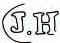
Afb. 17. Merk van de dekselmaker, 'J.H.'. Zie afb. 3, 6.